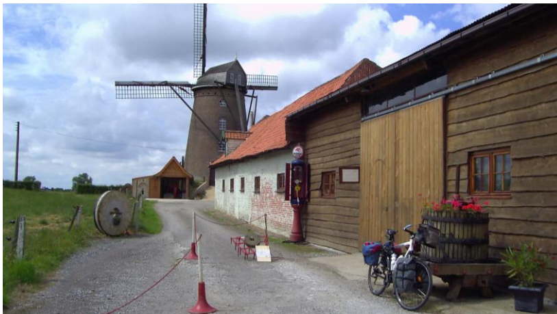
Photo avant de repartir et je commence à enchaîner quelques petites côtes.

Petit ennui à l'entrée de Caestre la roue avant est dégonflée. Arrêt à un abri bus pour réparation. Démontage des sacoches avant, pour atteindre la roue, puis démontage du pneu et gonflage de la chambre pour vérification... pas de fuite apparente, sans oublier le problème rencontré avec la pompe, mais solution trouvée assez rapidement. Il me semble ne pas y avoir de